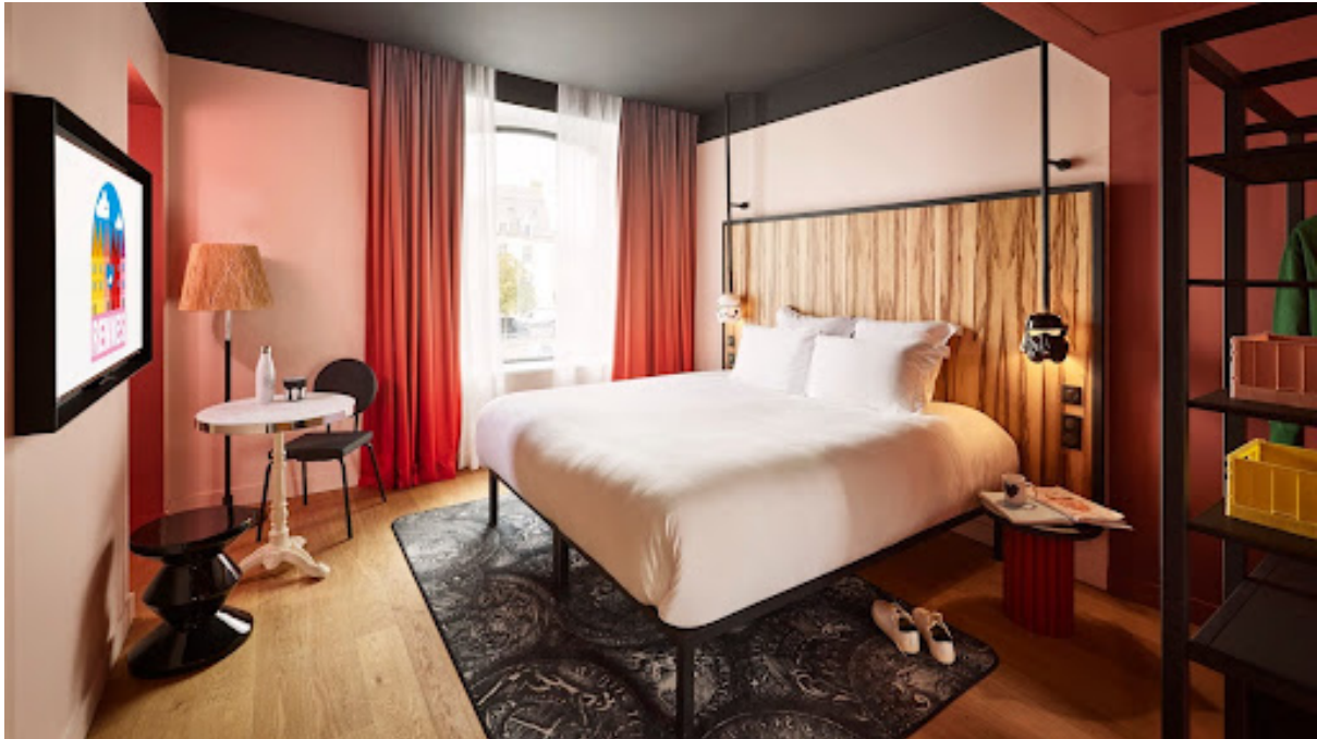
Mama Shelter

Als jüngster Ableger der Kette Mama Shelter hat sich dieses 4-Sterne-Hotel mit 119 Zimmern in der ehemaligen Münzprägeanstalt mitten in der Altstadt niedergelassen. Ein Boutique-Hotel mit Dachterrasse und Panorama-Restaurant, die einen traumhaften Blick auf die Wahrzeichen der Stadt bieten. Außerdem gibt es eine Bar, ein Spa, ein Schwimmbad, Karaoke-Räume und Lebensmittelläden mit lokalen Spezialitäten sowie einen Innenhof im Dorfplatz-Ambiente.